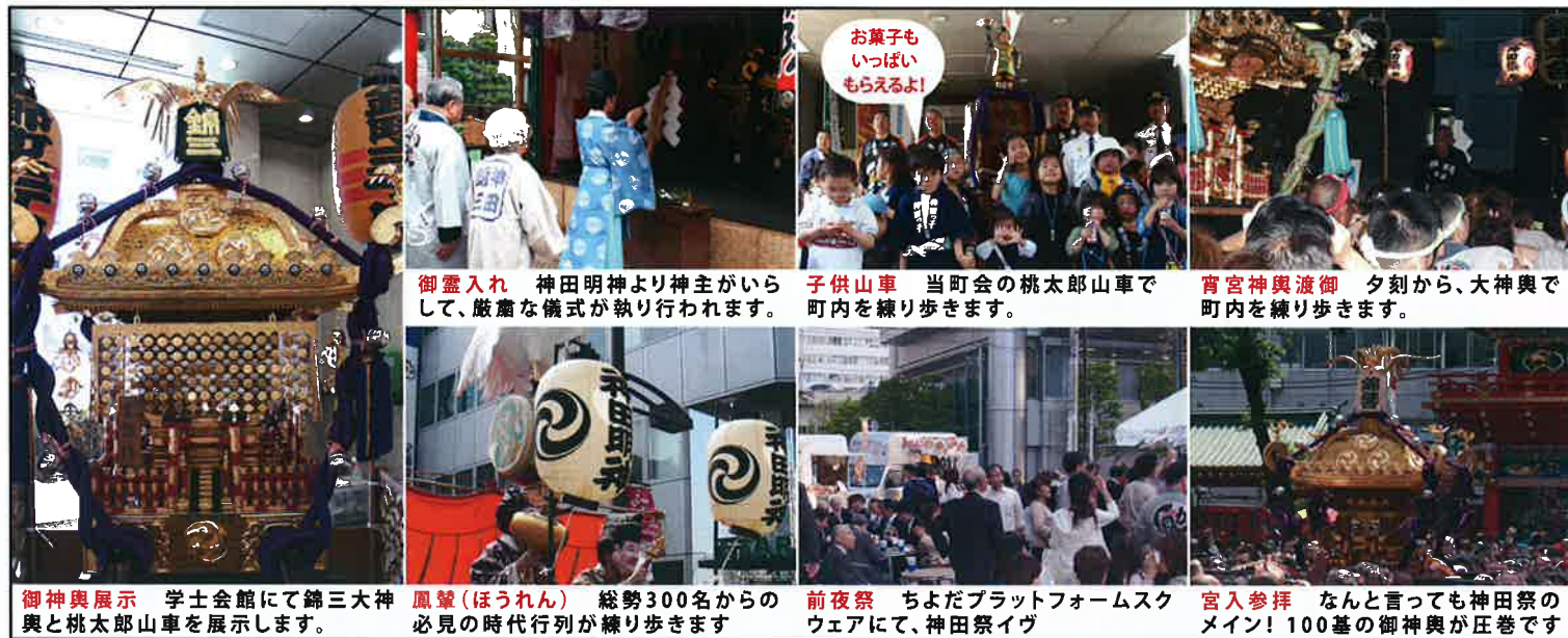
御神輿展示 学士会館にて錦三大神輿と桃太郎山車を展示します。 鳳輦(ほうれん) 総勢300名からの必見の時代行列が練り歩きます。 前夜祭 ちよだプラットフォームスクウェアにて、神田祭イブ 宵宮神輿渡御 夕刻から、大神輿で町内を練り歩きます。